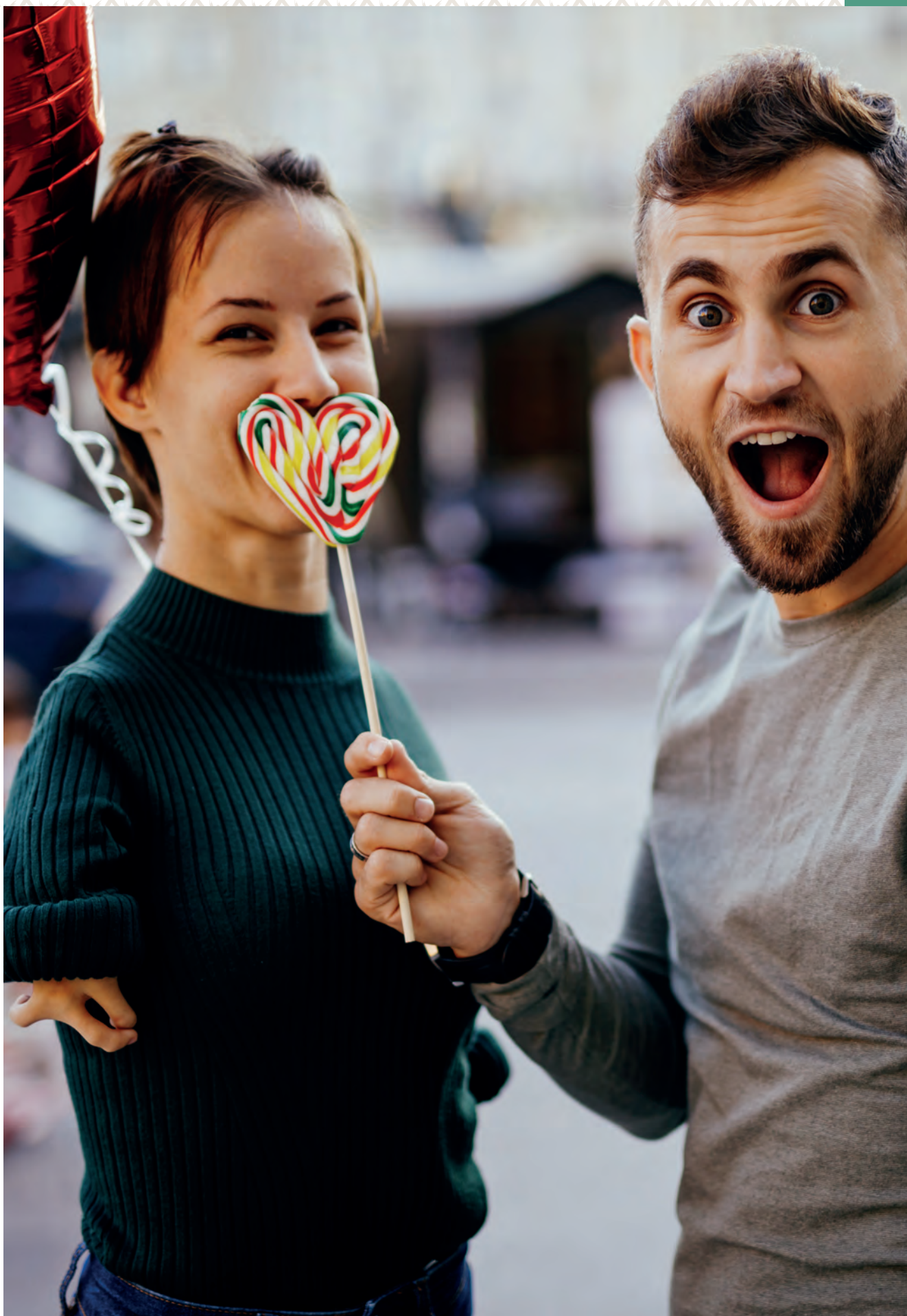
To personer, èn av dem med dysmeli, og en hjerteformet kjærlighet på pinne. Foto.