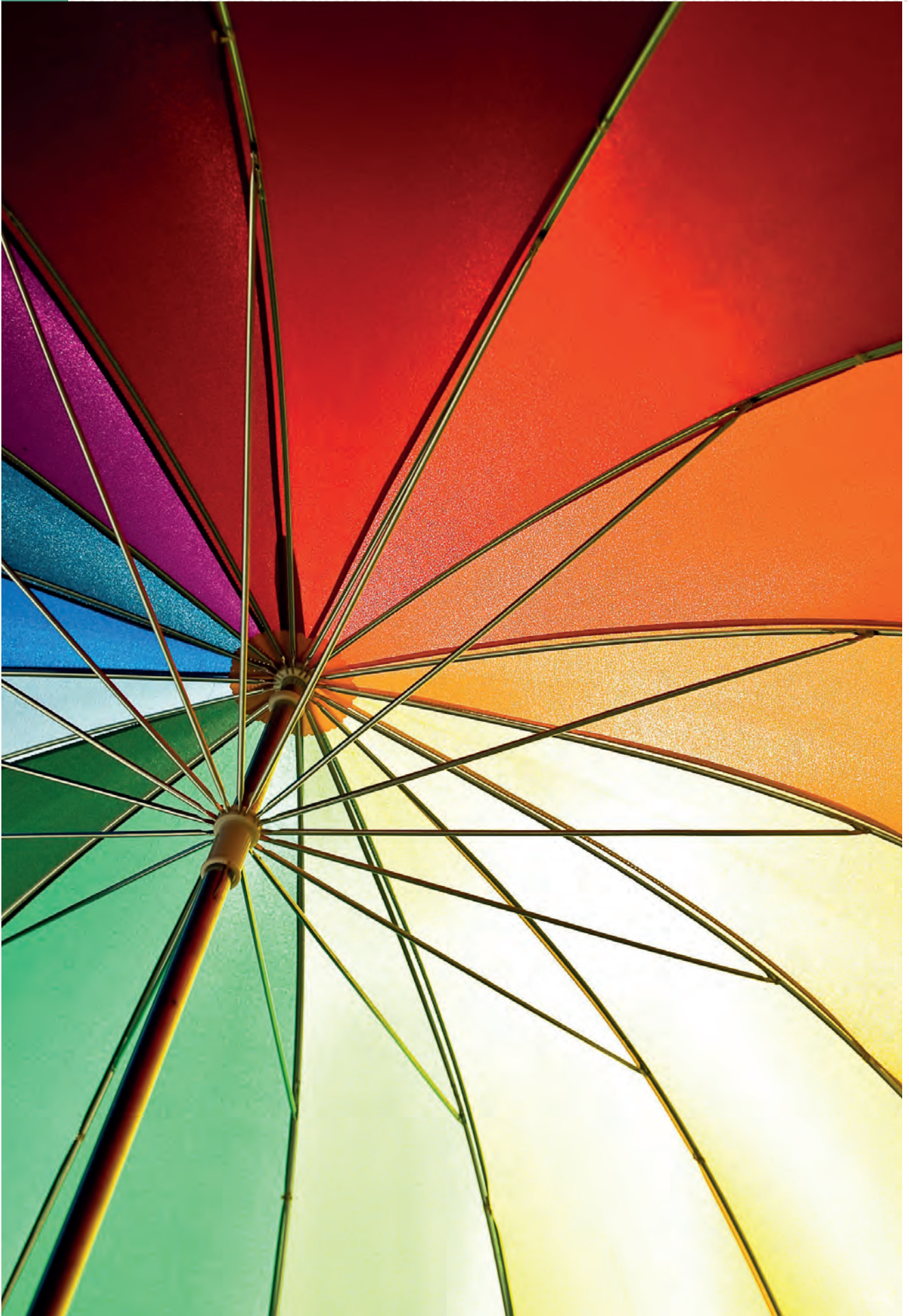
Oppslått fargerik paraply. Foto.