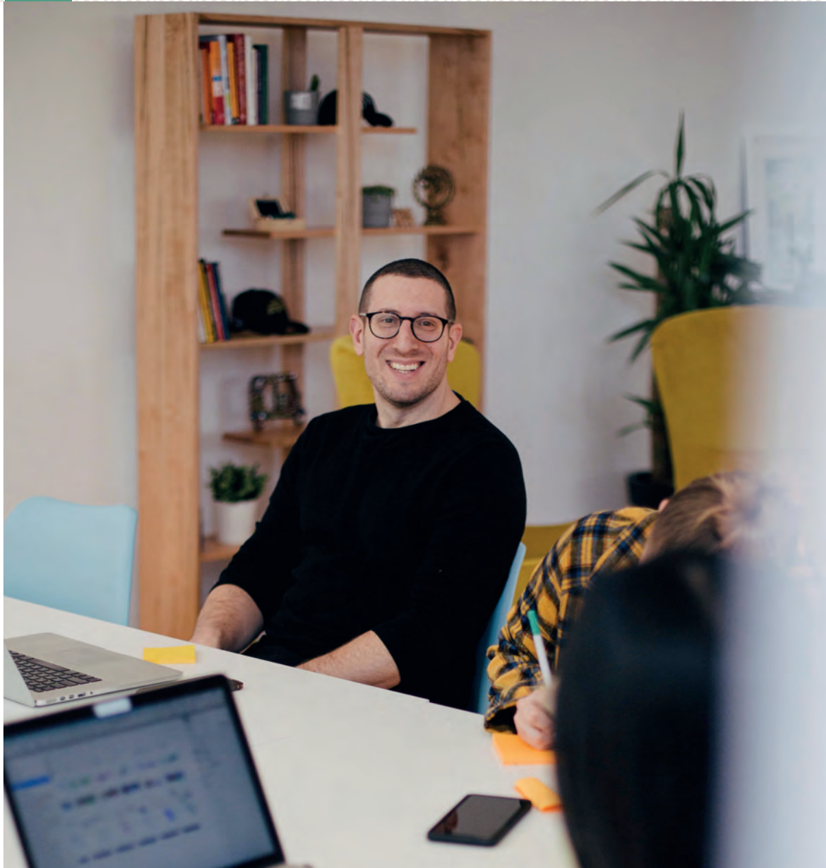
Smilende mann på kontor. Foto.