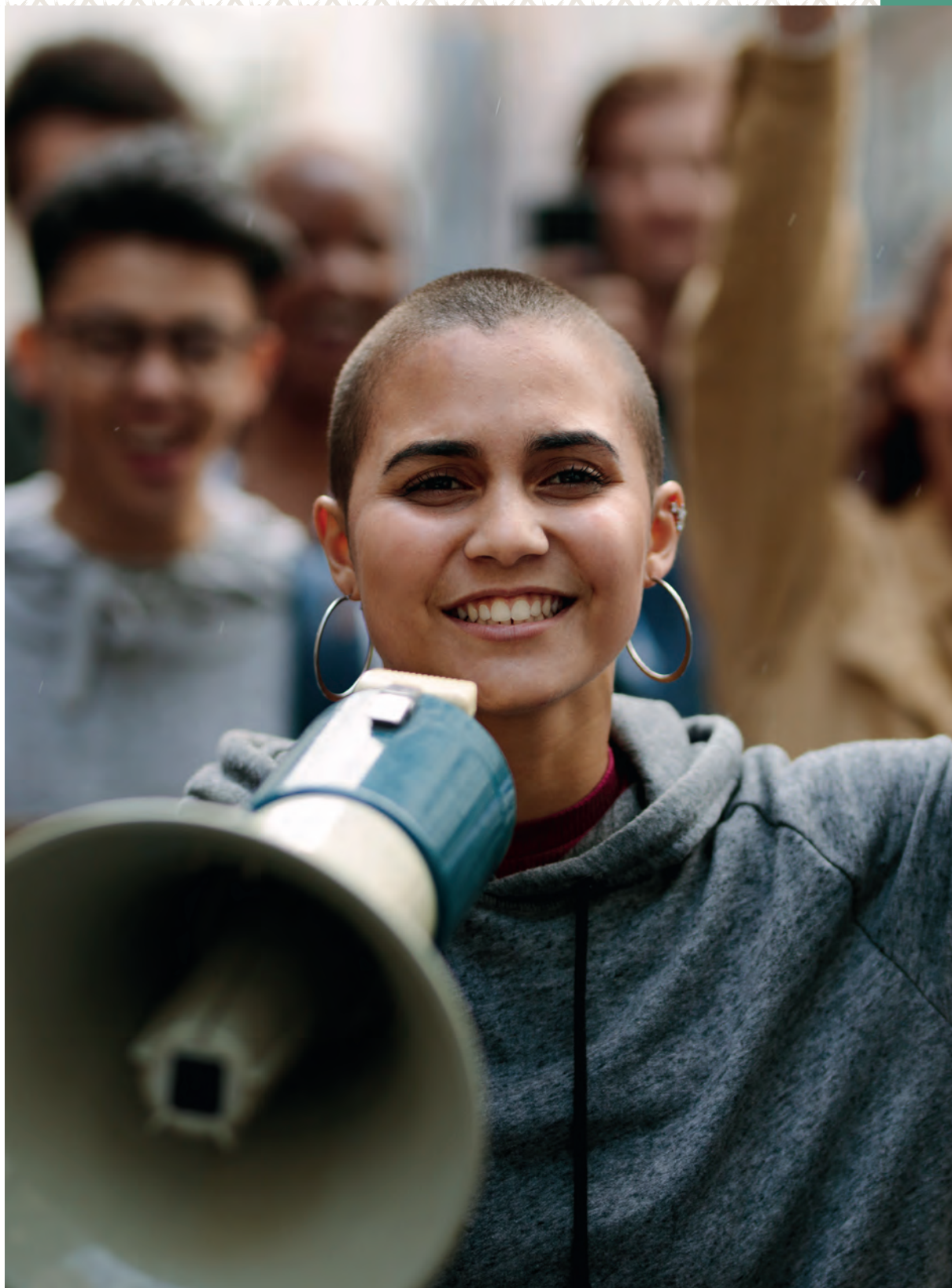
Jente med megafon. Flere mennesker i bakgrunnen. Foto.

Valgkamp og kampanjer samt arrangement og handlinger i tilknytning til det. De årene det er valg er det en felles satsing nasjonalt og i fylkene, og det utvikles gjerne felles materiell for bruk. Utenom valgperioder initieres det kampanjer som setter lys på viktige områder for oss, og her forventes det at fylkes-FFO bidrar i påvirknings- og synlighetsarbeid. Eksempel på FFOs kampanjer er å finne på FFOs nettsider .