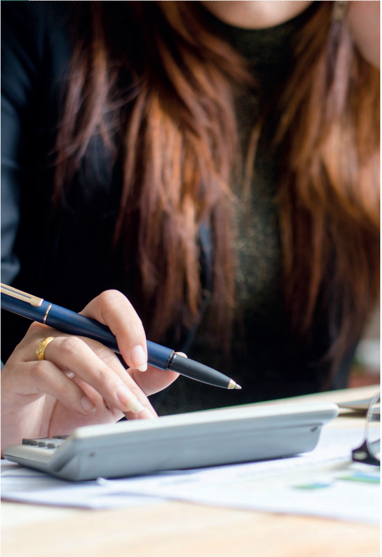
Nærbilde av person som holder en penn og trykker på kalkulator. Foto.