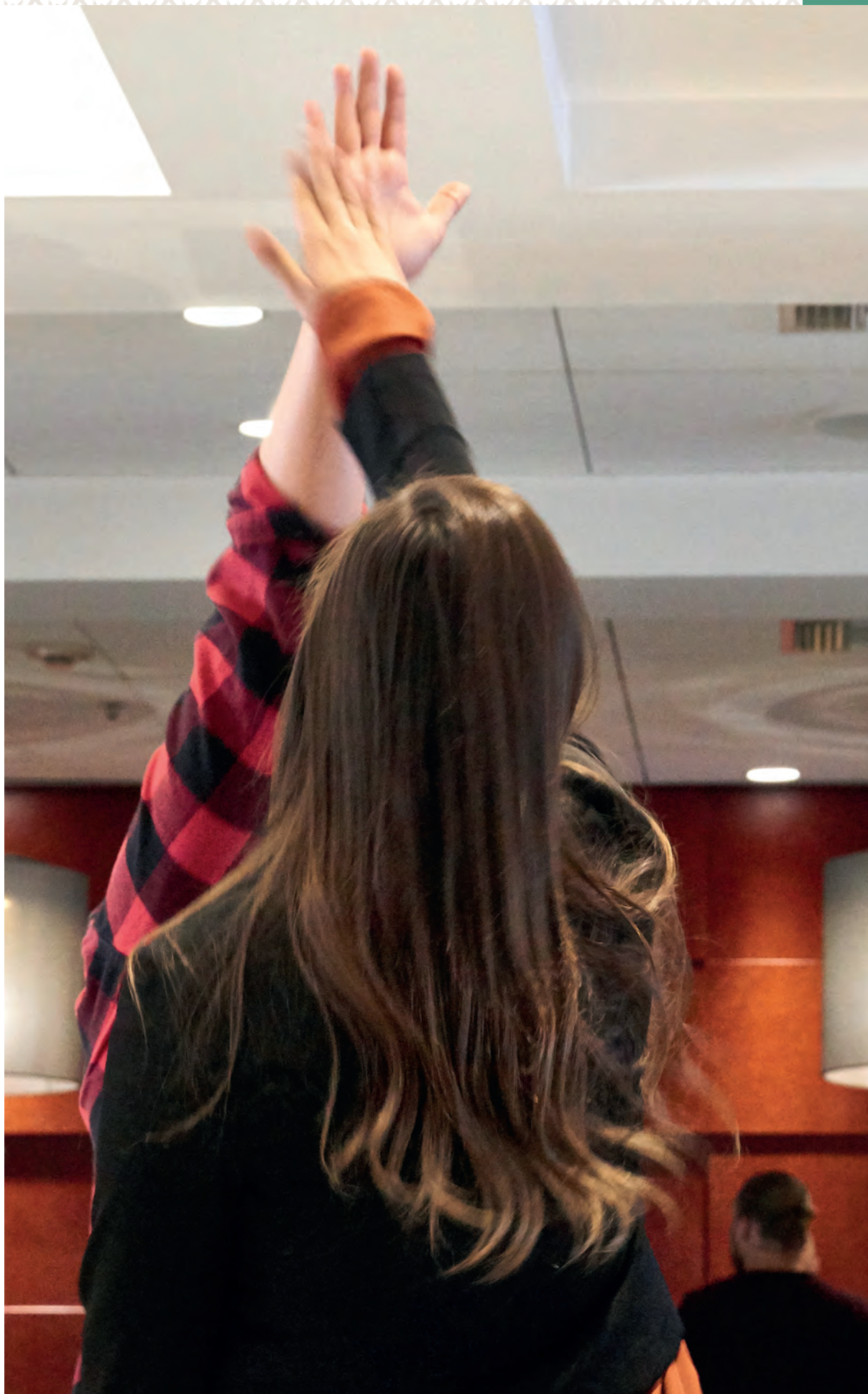
To personer slår hendene mot hverandre som en "high five". Foto.