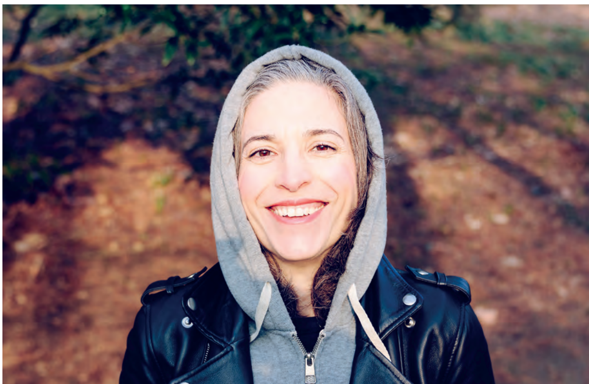
Portrett av smilende dame. Foto.