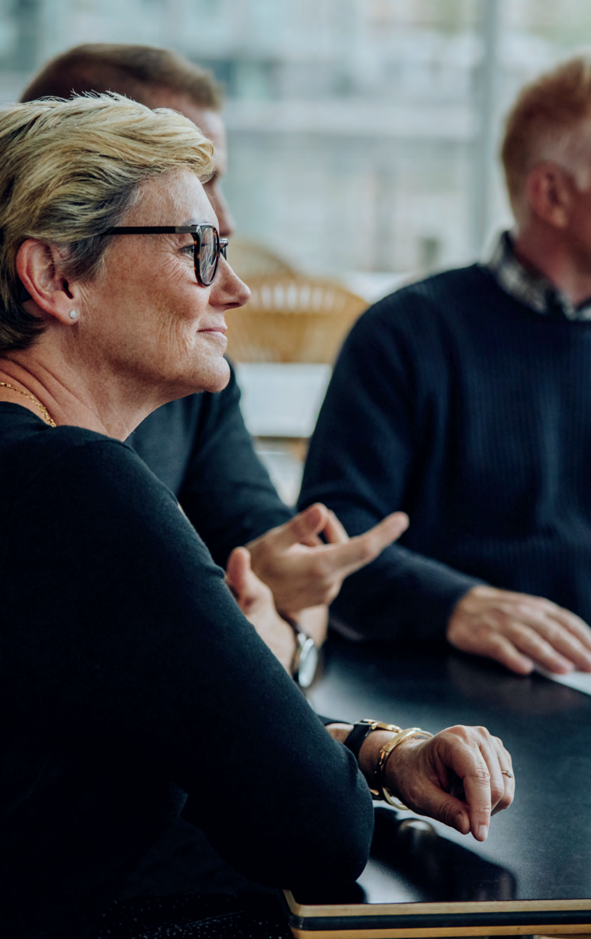
Møte rundt et bord. Profil av kvinne i fokus. Foto.