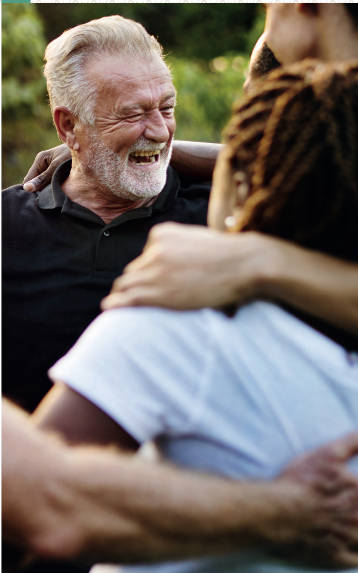
Gruppe av mennesker med fokus på smilende mann. Foto.