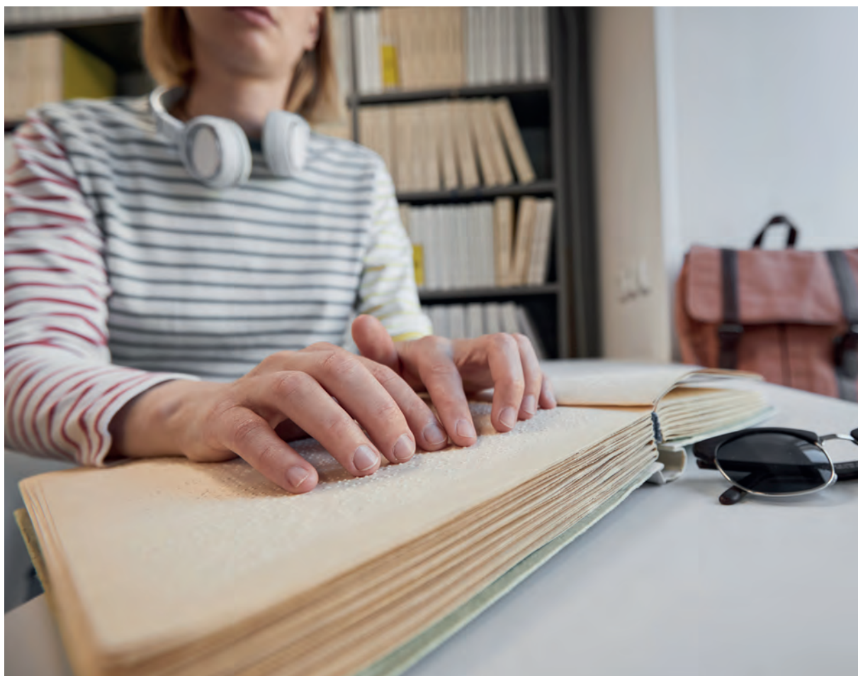
Person leser punktskrift. Foto.