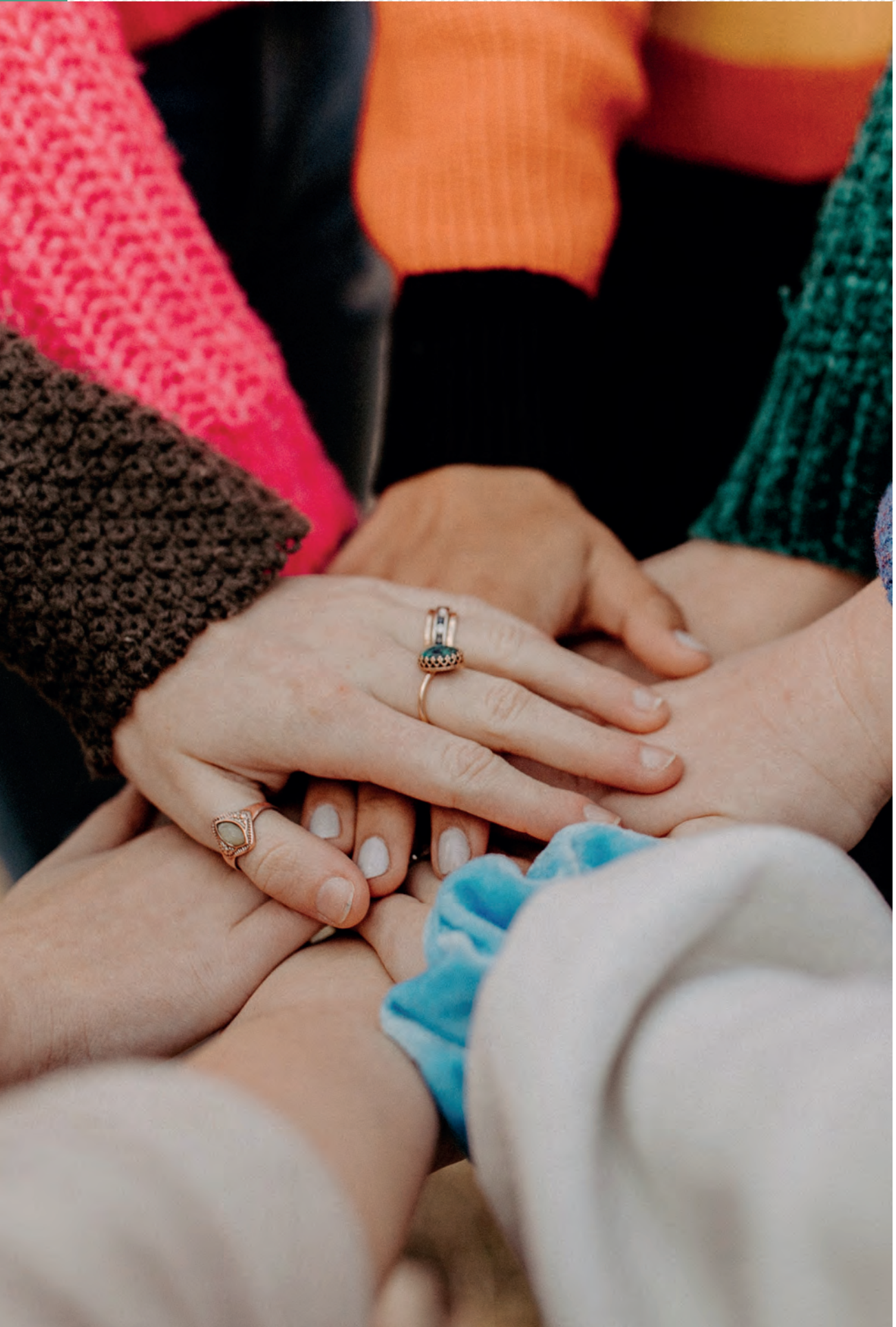
Nærbilde av flere personer som stabler hendene oppå hverandre. Foto.